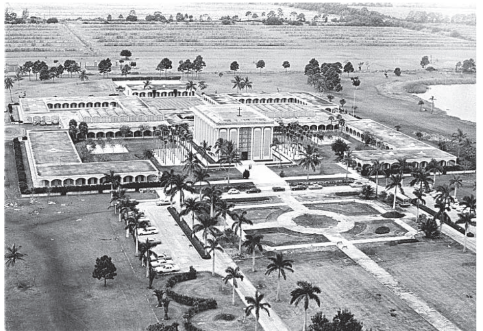
Seminario Mayor San Vicente de Paúl, Boynton Beach.