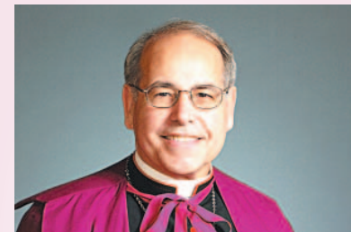
Obispo Felipe J. Estévez, nombrado el 21 de noviembre de 2003; ordenado el 7 de enero de 2004