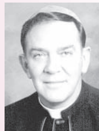
Obispo Norbert M. Dorsey, CP, nombrado el 10 de enero de 1986; nombrado obispo de Orlando el 10 de marzo de 1990.