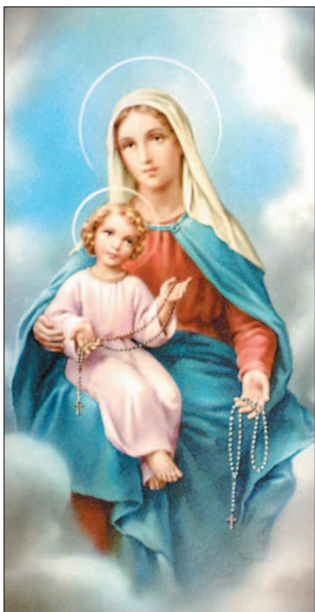
Nuestra Señora del Rosario, patrona de la Arquidiócesis de Miami.

El Poderoso ha hecho obras grandes por nosotros; su nombre es santo.