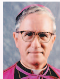
Obispo Gilberto Fernández, nombrado el 24 de junio de 1997; retirado el 10 de diciembre de 2002.