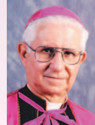
Obispo Agustín A. Román, nombrado el 25 de enero de 1979; retirado el 7 de junio de 2003.