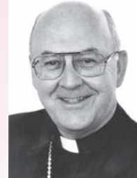
Obispo John J. Nevins, nombrado el 25 de enero de 1979; nombrado primer obispo de Venice el 17 de julio de 1984.