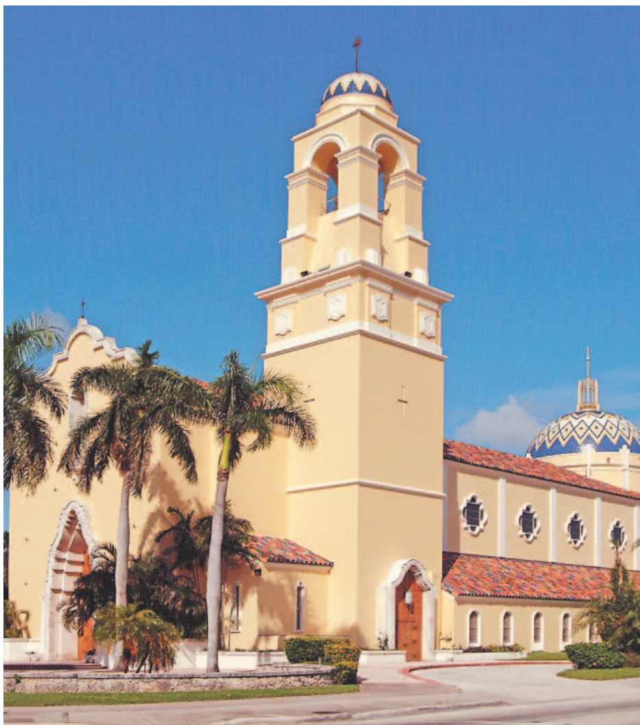
Catedral St. Mary, Miami.

El Poderoso ha hecho obras grandes (Continúa en la página 10)