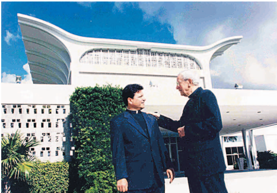
Seminario Menor San John Vianney, Miami.